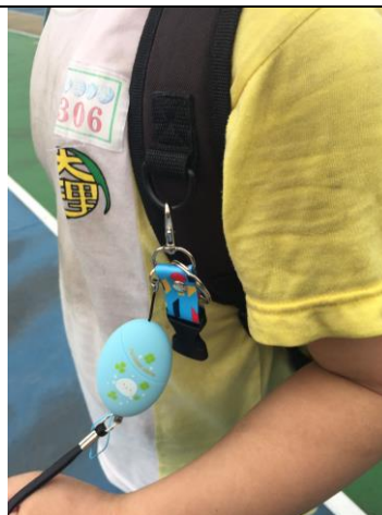
圖2 綁在書包肩帶扣環上