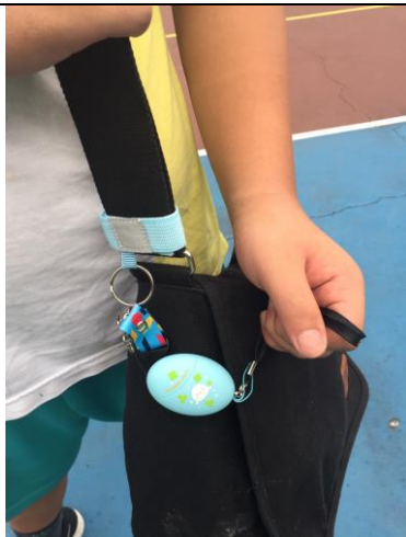
圖5 單肩或斜背書包，綁在帶子或扣環