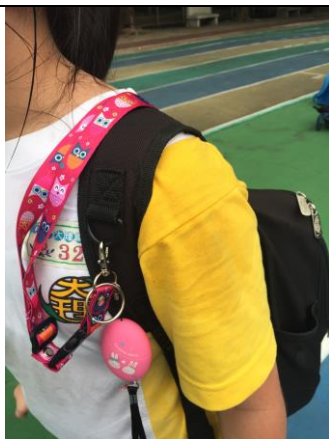
圖3 繞過提把纏在肩帶上