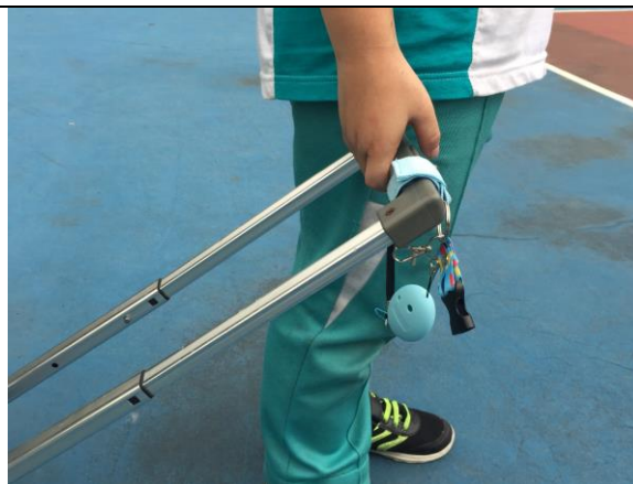
圖4 纏在書包提把上