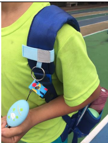
圖1 綁在書包肩帶上